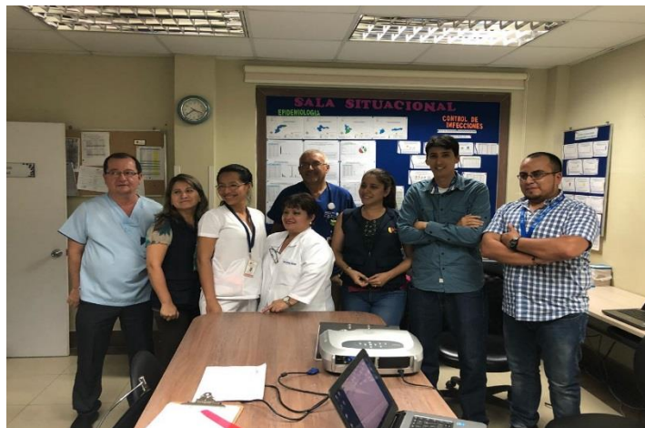
Consultor y Facilitador de URC junto a EMCC

De esta manera la reunión concluyó con las manifestaciones de apoyo e interés por parte de los médicos del Hospital Verdi Cevallos hacia el proyecto, y con el compromiso para continuar con el proceso de mejora continua de calidad para la atención a los niños y madres afectadas por el epidemia del Zika en la provincia.