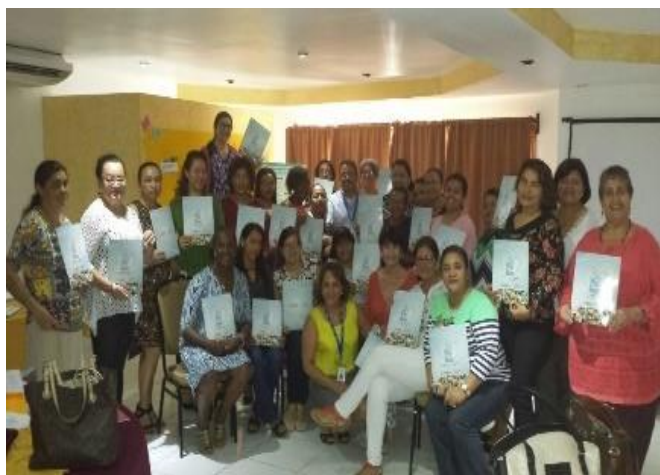
Primer grupo de consejeras Capacitadas en consejería de PF/ZIKA en SPS

Mediante el seguimiento de campo realizado en agosto 2016 a los Establecimientos de Salud (ES) intervenidos en el tema Zika, se identificaron oportunidades de mejora en la calidad de la atención de consejería de Planificación Familiar (PF), debido a que hay debilidades en la organización del servicio, debilidad en las competencias y habilidades técnicas de los proveedores para brindar consejería, debilidad en conocimientos actualizados sobre metodología anticonceptiva, oferta no consistente de los servicios de PF en ES, sub registro de información, principalmente. En base a lo anterior, la Secretaría de Salud con el Proyecto de ASSIST -Zika define el abordaje en las regiones priorizadas con enfoque de mejoramiento colaborativo en Planificación Familiar e integrado Consejería de Zika. Una de las primeras actividades realizadas fue la identificación de las consejeras/os en PF ya existentes o donde no había se identificaron personas de acuerdo al perfil que deben tener las consejeras/os. Un segundo paso fue la capacitación del personal identificado.