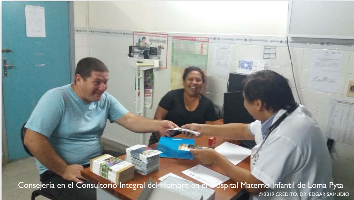
Consejería en el Consultorio Integral del Hombre en el Hospital Materno Infantil de Loma Pyta

Aplicando la Ciencia para Fortalecer y Mejorar los Sistemas de Salud