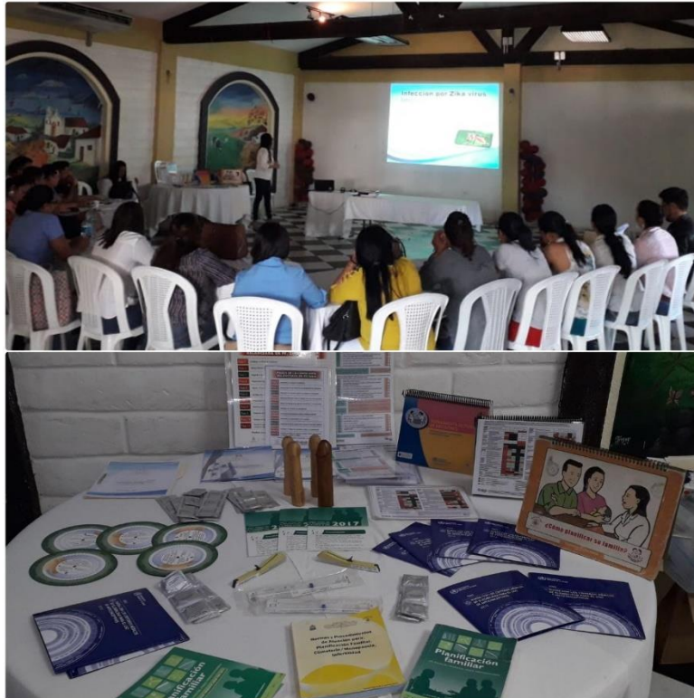
Capacitación PF en el Progreso, Yoro.