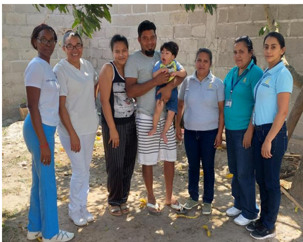
Realización de visitas domiciliarias.

2.-Una vez identificado el caso de niños con SCaZ, se procede a localizarlos realizando visitas domiciliarias por parte del personal de los establecimientos de salud (confirmando los sitios previamente), se les proporcionan citas a los familiares para que se presenten a los establecimientos correspondientes para que se les brinde un seguimiento oportuno e integral.