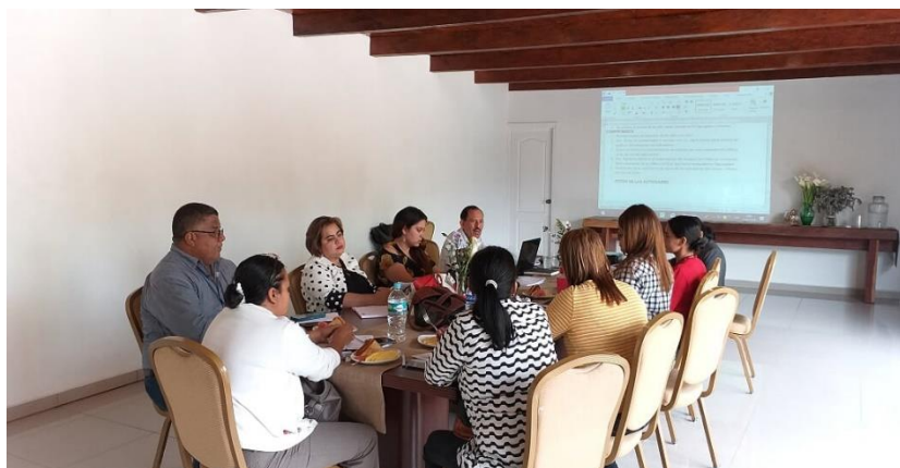
Sesión del Comité Regional de Zika de Olancho