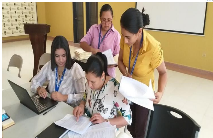
Verificación de indicadores de monitoreo con la Unidad de Fomento, Unidad Marco Normativo, Hospital Católico Santo Hermano Pedro.

A continuación, una imagen de la hoja elaborada que ha servido para el tamizaje, para registro de la información y como una ayuda de trabajo.