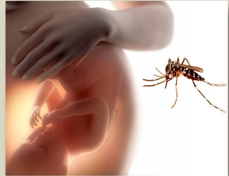
De madre a hijo