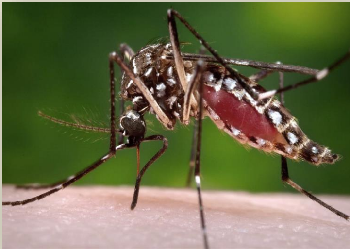
Picadura del mosquito Aedes