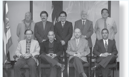
Junta Directiva, Caja Costarricense de Seguro Social

La Junta Directiva de la Caja Costarricense del Seguro Social, en su interés de continuar fortaleciendo las acciones y políticas tendientes al mejoramiento continuo de la Seguridad Humana en los Hospitales y Clínicas, avala el documento “ Política Institucional de Calidad y Seguridad del Paciente ”, en el cual se integran los principales lineamientos y normativas que en materia de calidad y seguridad del paciente han sido establecidos, lo anterior como complemento de los programas y acciones que sobre esta materia son ejecutadas por las diferentes instancias institucionales.